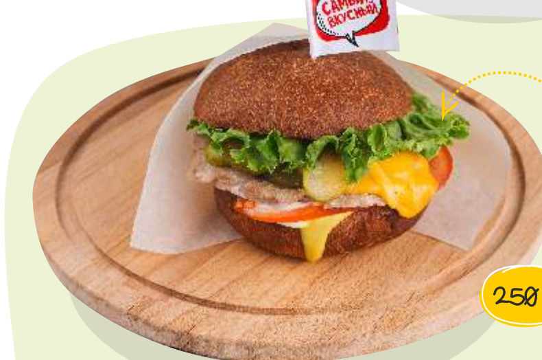
П АПА- бургер с куриной котлетой 190 г