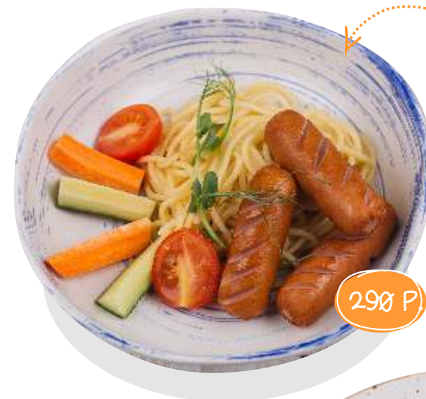
О тварные сосиски с гарниром на ваш выбор: картофель фри, картофельное пюре, спагетти 180/300 г