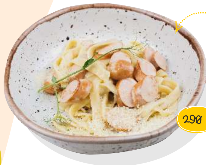
Д омашняя паста с куриным филе или сосиской на выбор 170 г