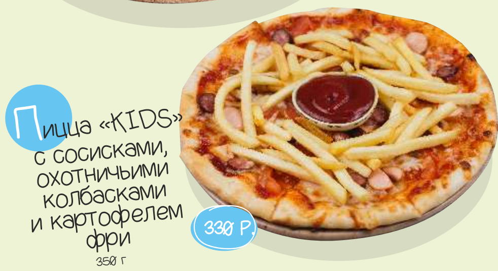
П ицца «KIDS» с сосисками, охотничьими колбасками и картофелем фри 350 г