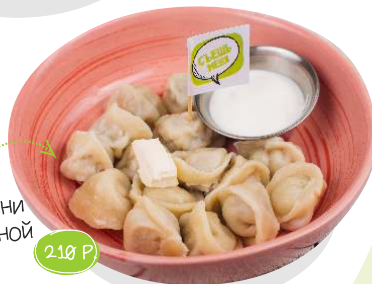
П ельмени со сметаной 150/300 г