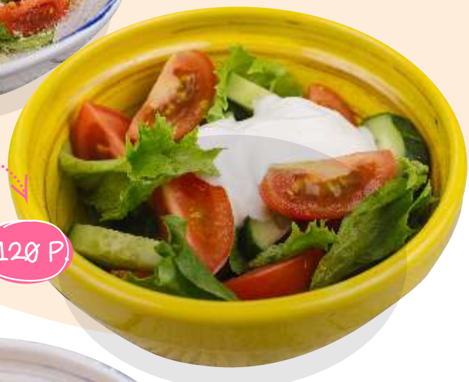
С алат из свежих овощей 120 г