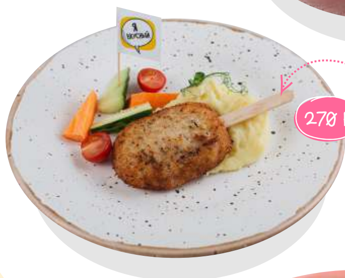
К уриная котлетка с гарниром на ваш выбор: картофель фри, картофельное пюре, спагетти 200 г