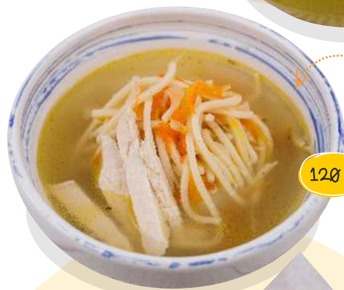
С уп-лапша с курицей 220 г