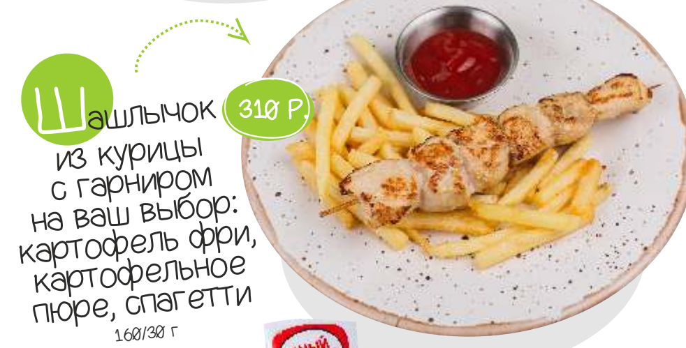
Ш ашлык из курицы с гарниром на ваш выбор: картофель фри, картофельное пюре, спагетти 160/300 г