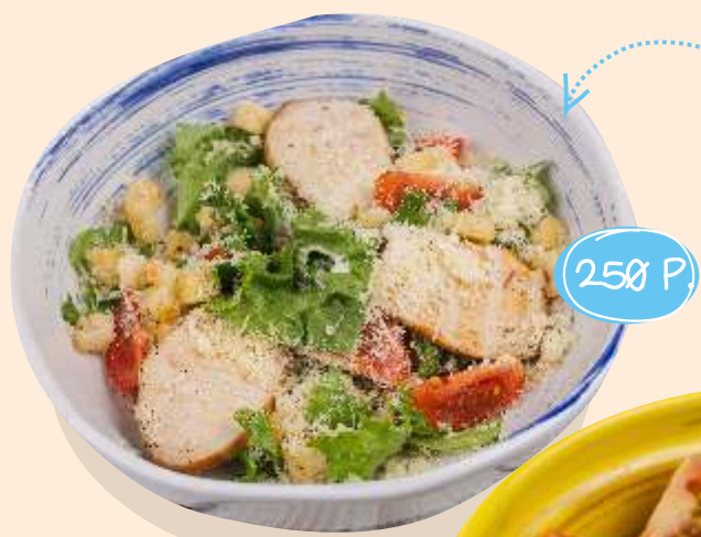
Ц езарь с курочкой 140 г